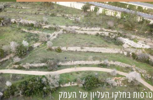
טרסות בחלקו העליון של העמק

עמק לבן העליון (שביל החוגלה) - הלוך חזור / אפשרות למעגלי (2 ק"מ) מהרחבה הגדולה (1) נפנה ימינה, בשביל עפר שמקיף את העמק (בסימון שביל ישראל). בחלק זה של העמק ניתן לראות שרידים חקלאיים רבים, בראש ובראשונה הטרסות המרשימות שביניהן מדרגות בנויות. לאחר כ-150 מ' נעלה ימינה במדרגות ונגיע לגת (2). הגת בנויה ממשטח דריכה, בור שיקוע ובור תסיסה ענק, שהוסב לבור איסוף מים בתקופה המודרנית. נמשיך ללכת לאורך הטרסה עד שנתחבר לשביל ישראל, ומשמאלנו נראה מבנה עגול בנוי