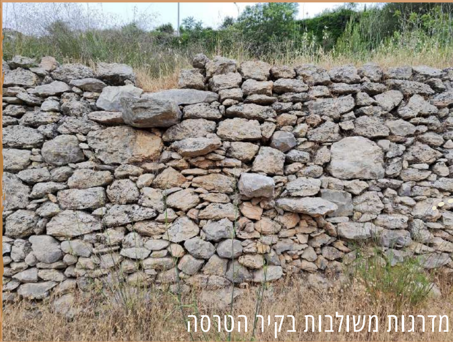
מדרגות משולבות בקיר הטרסה

בחלקו העליון של העמק התקיימה חקלאות בעל המבוססת על גשמי החורף ובחלקו התחתון, נמוך מקו המעיין, קוימה חקלאות שלחין - המשלחת את מי המעיין לחלקות העיבוד על גבי הטרסות באמצעות תעלות השקיה. בשטחי הבעל גידלו בעיקר עצי פרי כזית, תאנה, שקד וגפן וגידולי חורף עונתיים כדגנים שונים. בשטחי השלחין גידלו ירקות למיניהם ועצי פרי אוהבי מים.