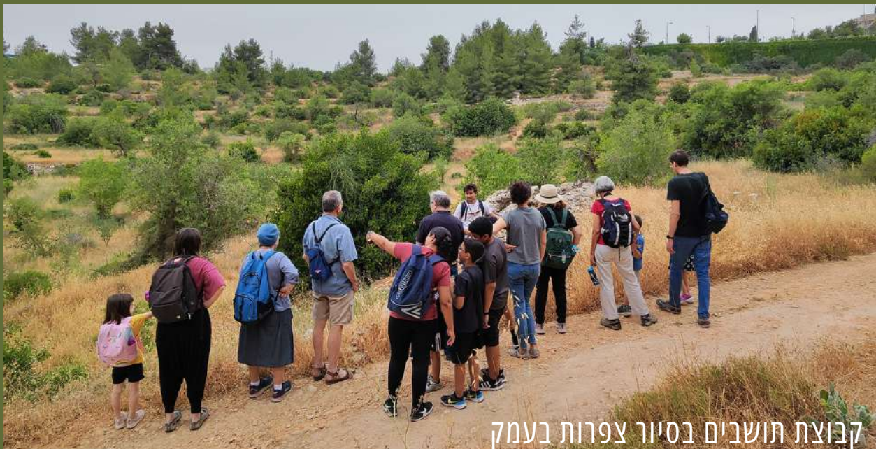
קבוצת תושבים בסיור צפרות בעמק

המקום עשיר במערכות חי וצומח, בשרידים ארכאולוגיים ובנוף תרבות קדום של חקלאות מסורתית במורדות ההר. העמק הוא חלק מאגן נחל רפאים ששימש בעבר כעורף חקלאי שסיפק מזון לתושבי ירושלים והאזור.