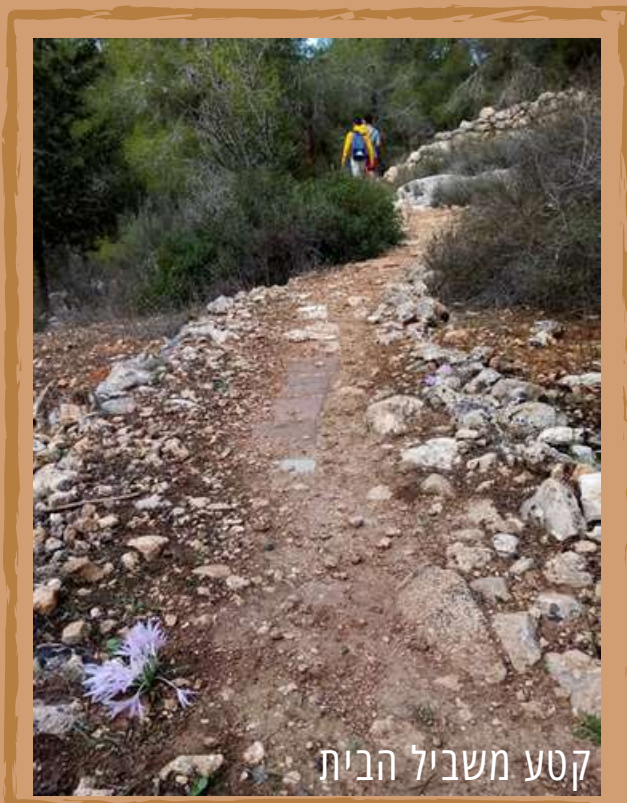
קטע משביל הבית

שביל הבית מתפצל משביל ישראל (הירידה לעין לבן) ליד המשאבות (6). מהמשאבות נפנה שמאלה, וכעבור כמה מטרים, לצד עמוד העירוב הראשון, נפנה ימינה וניכנס לשביל צר יחסית, העובר בתוך החורשה, וחלקו מרוצף. את השביל ריצף וסימן תושב קריית מנחם על גבי שביל קדום, תוך שימוש בפסולת חומרי בנייה שניתן לראות לאורך השביל. מכאן מגיע שמו - שביל הבית - על שם המרצפות וחפצי הבית שניתן לראות לאורכו. השביל יורד לכיוון דרום מזרח, וניתן לראות בו (בעונתם) נרקיסים, רקפות, כרכומים, עיריות וכלניות. כעבור כ-400 מ' נרד כמה טרוסות והחורש יהפוך צפוף. בנקודה זו, כשמולנו גדר גן החיות, השביל נעשה פחות ברור, ואנחנו נסתובב על עקבותינו ונחזור. במקביל לשביל הבית, אפשר גם לטייל בשביל סובב משואה, דרך עפר רחבה ונוחה באורך של כ-2 ק"מ, המקיפה את כל השכונה ומגיעה עד מלון יהודה. גם אל השביל הזה נגיע מנקודת הפיצול משביל ישראל ליד המשאבות (6). נפנה שמאלה במשאבות, נחלוף על פני הכניסה לשביל הבית וכעבור כמה מטרים נפנה ימינה לדרך העפר הרחבה - שביל סובב משואה. נחלוף בדרך על פני שער חורשות קק"ל (8), שממנו יורד שביל, לא מוסדר, שניתן להתחבר ממנו לשביל הבית (הסימון המקווקוו במפה).